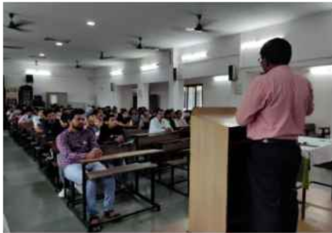
Guru Purnima Celebration 2022-23