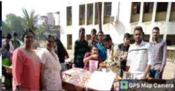
Navi Mumbai, Maharashtra, India SMDL college Kalamboli Lat 19.028026° Long 73.104016° 13/01/23 11:28 AM GMT +05:30