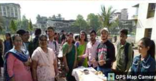
Navi Mumbai, Maharashtra, India SMDL college Kalamboli Lat 19.028026° Long 73.104016° 13/01/23 11:27 AM GMT +05:30