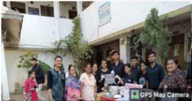
Navi Mumbai, Maharashtra, India SMDL college Kalamboli Lat 19.028026° Long 73.104016° 13/01/23 11:11 AM GMT +05:30