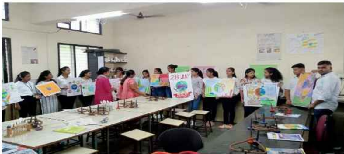
Nature Conservation Day- Microbiology Department 2022-23