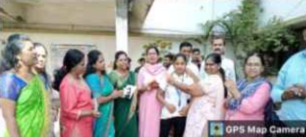
Navi Mumbai, Maharashtra, India SMDL college Kalamboli Lat 19.028026° Long 73.104016° 13/01/23 11:09 AM GMT +05:30