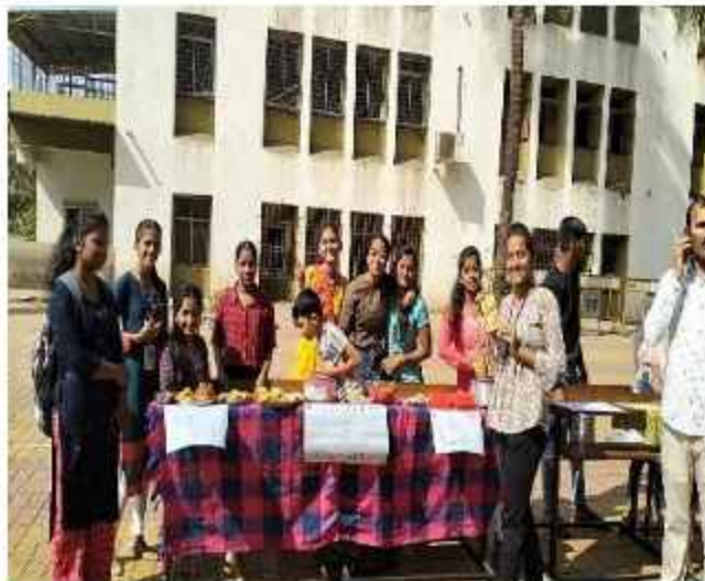
Food Festival of Science Department – 2022-23