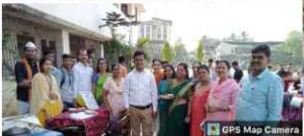
Navi Mumbai, Maharashtra, India SMDL college Kalamboli Lat 19.028026° Long 73.104016° 13/01/23 10:57 AM GMT +05:30