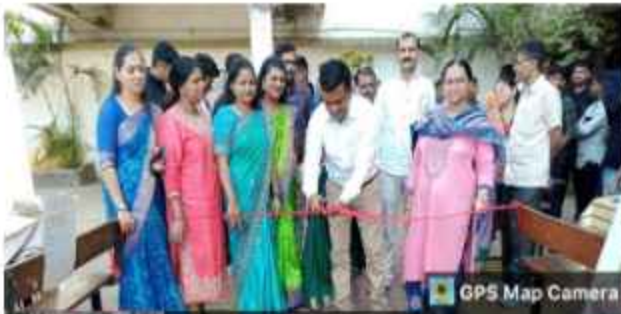
Navi Mumbai, Maharashtra, India SMDL college Kalamboli Lat 19.028026° Long 73.104016° 13/01/23 10:36 AM GMT +05:30